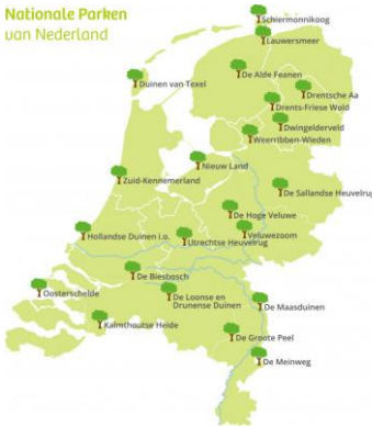
Nationale Parken van Nederland

In Nederland zijn 22 Nationale Parken. Deze Parken vertellen samen het verhaal van de Nederlandse natuur.