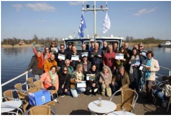
Onze groep enthousiaste gastheren/-vrouwen tijdens de middag